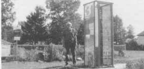
Dans le cadre des célébrations entourant le centenaire du quartier, qui se dérouleront sur plusieurs semaines, l'Association des résidents de Deschênes (ARD) a récemment érigé un parcours d'interprétation historique le long du chemin Yanier.

Associant tours aux vidéos et présentations des images thématiques et des récits écrits sur l'histoire de Deschênes, qui sont installés à diverses intersections, M. Powles invite les gens à visiter le quartier et à en apprendre davantage sur son importance historique. « Les habitants de Deschênes sont fiers de leur histoire et ont hâte de partager les accomplissements des familles, entrepreneurs et politiciens du secteur », a dit M. Powles dans un communiqué.