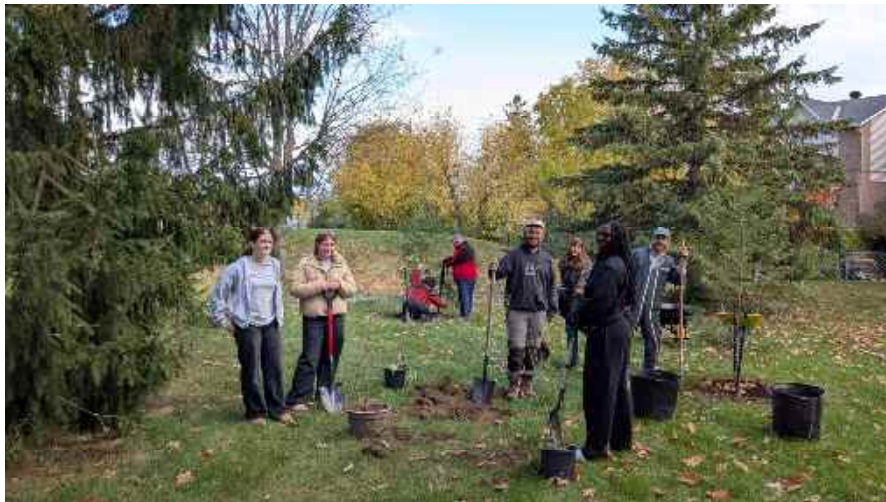
Plantation d'arbres 2025