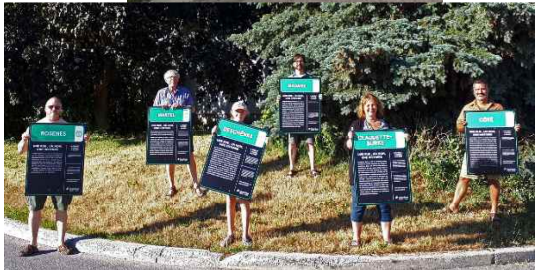
Double centenaire de Deschênes 2020-2023