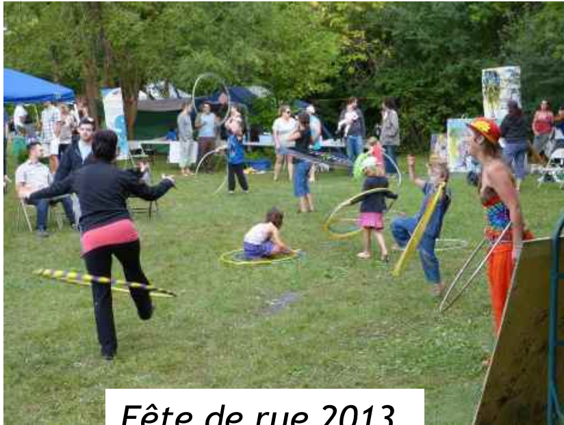
Fête de rue 2013