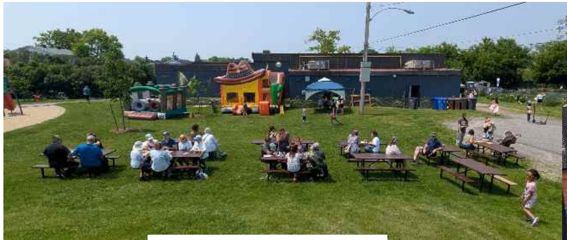
Fête des voisins