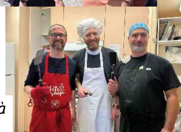
Cabane à sucre