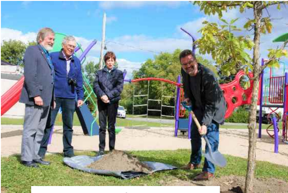
25 e parc Madaire 2017