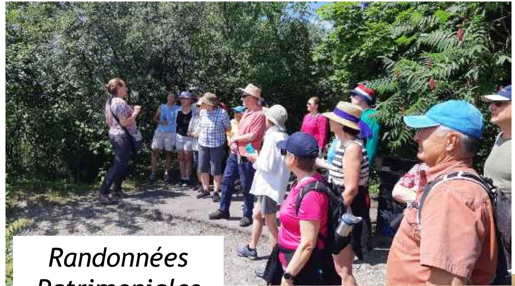
Randonnées Patrimoniales 2013+